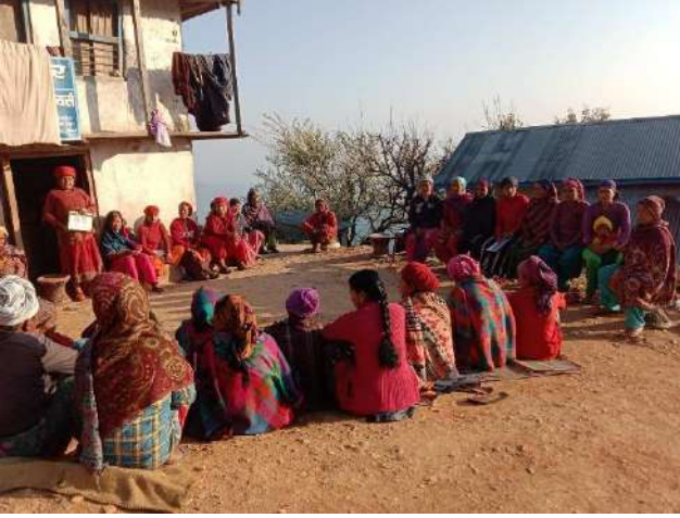
आमा समूहलाई स्वास्थ्य शिक्षा सम्बन्धी कक्षा सञ्चालन