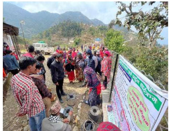
सुधारीएको फलामे चुलो प्रदर्शनी र अनुदानमा वितरण