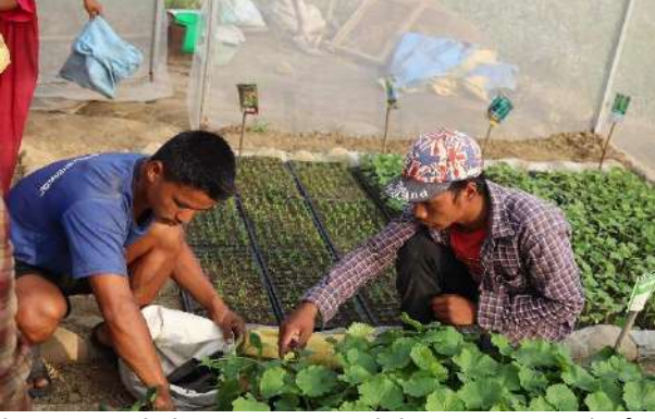
रियलाइज परियोजना अन्तरगत भेरीगंगा न.पा मा बेर्ना वितरण