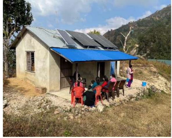
१.२ KWP को सौर्य ऊर्जा प्रणाली जडान