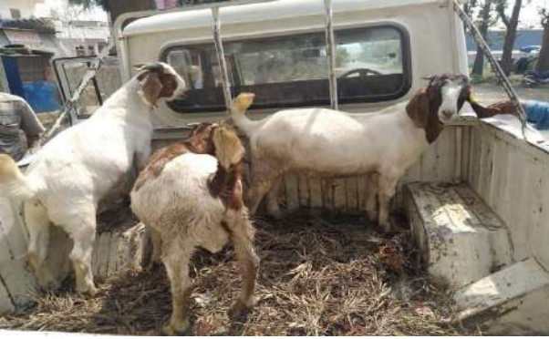
रियलाइज परियोजना अन्तरगत भेरीगंगा न.पा मा पर्ने तल्लो भर्थाड र साधनेमा बोयर बाख्रा वितरण