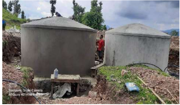
रियलाइज परियोजना अन्तरगत बराहताल गा.पा मा श्रीमूल सोलार लिफ्ट खानेपानी आयोजनामा खानेपानी ट्याङ्की निर्माण