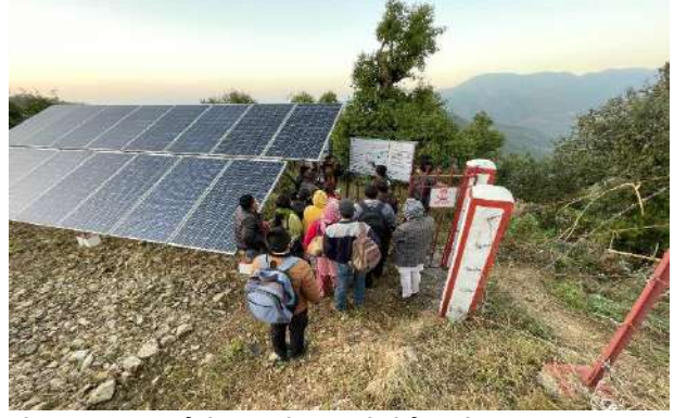
रिन्यूएबल वर्ल्डको सहयोगमा निर्मित सोलार मुस खानेपानी आयोजनामा भ्रमण