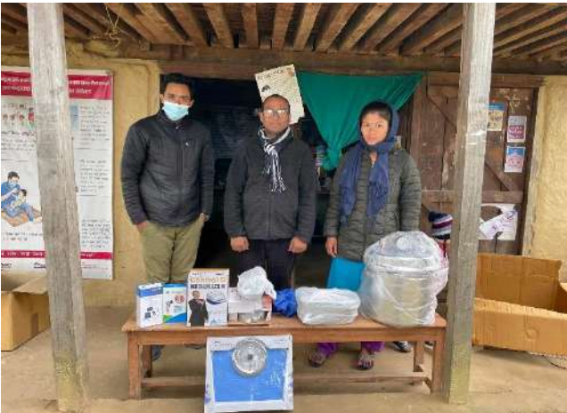
सामुदायिक स्वास्थ्य केन्द्र, बराहताल-६, विउरेनीमा स्वास्थ्य सामग्री सहयोग