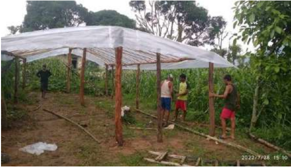
इनरिच परियोजना अन्तरगत भेरीगंगा न.पा मा पलाष्टिक टनेल निर्माणमा सहयोग